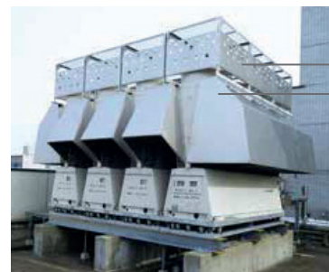
Universal Smart X EDGE

Ochranná síť proti sněhu Ochranný kryt proti sněhu